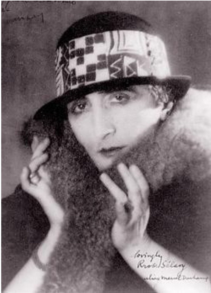
Rose Selavy gefotografeerd door Man Ray