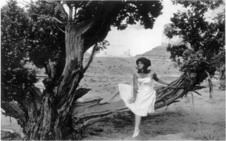
Cindy Sherman, Untitled Film Still, 1978